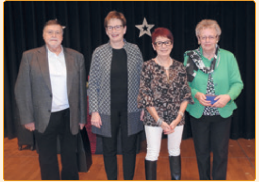
den Här an d'Madame Portha – Kersch