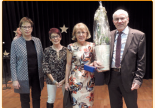
den Här an d'Madame Schlessler – Wagner