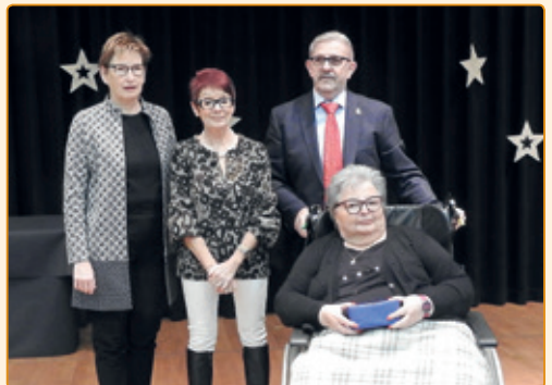
den Här an d'Madame Jungers – Regenwetter