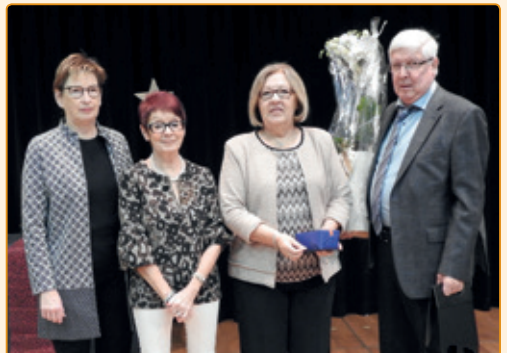
den Här an d'Madame Folschette – Schenten