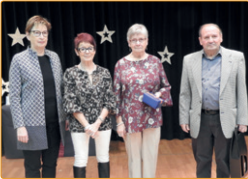
den Här an d'Madame Schmit – Bieber