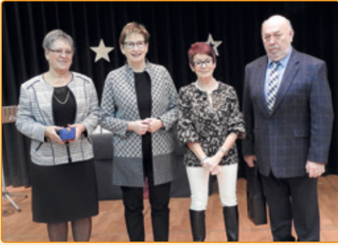
den Här an d'Madame Reding – Meiers