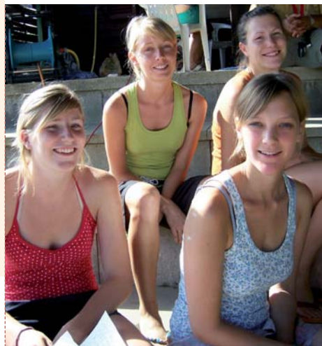
Eis Animatricen beim Vakanzatelier 06

Mir sichen dréngend e Numm fir dat neit Jugendhaus zu Bierchem. Wann dir Propositionen hutt, da mailt eis se op dekeller@pt.lu oder maacht eis e Message an d'Guestbook op eiser Homepage: www.mj-roeser.net . Vergiesst net äer Kontaktadress ze hannerloossen, well deem säi Virschlag geholl gett eng kleng Belounung kritt.