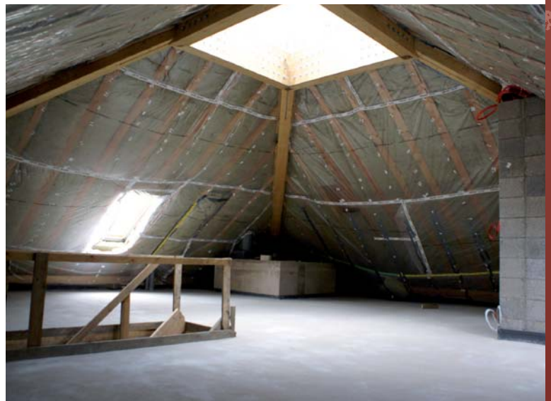
Den Entspannungs- a Liesraum am neie Jugendhaus zu Bierchem