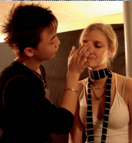
Fotoshooting am Keller