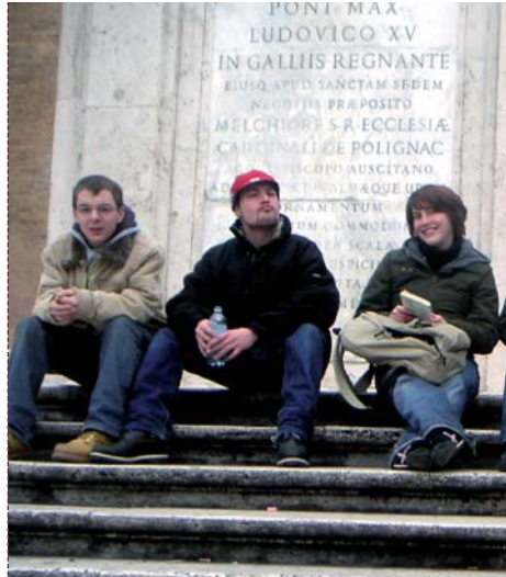
City Trip op Roum

Aktuell Informatiounen iwwer d'Jugendhaus, eng Fotogalerie an e Guestbook fann dir säit kuerzem op eiser neier Homepage: www.mj-roeser.net .