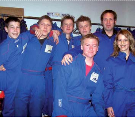
Karting zu Metz-Augny