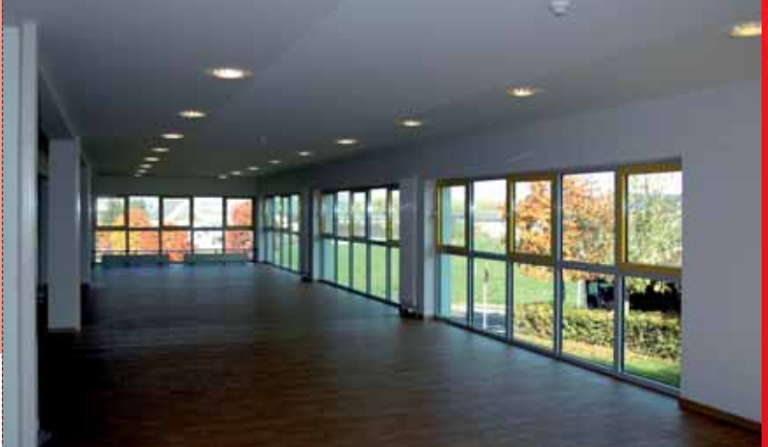
Salle « Théd Czekanowicz »